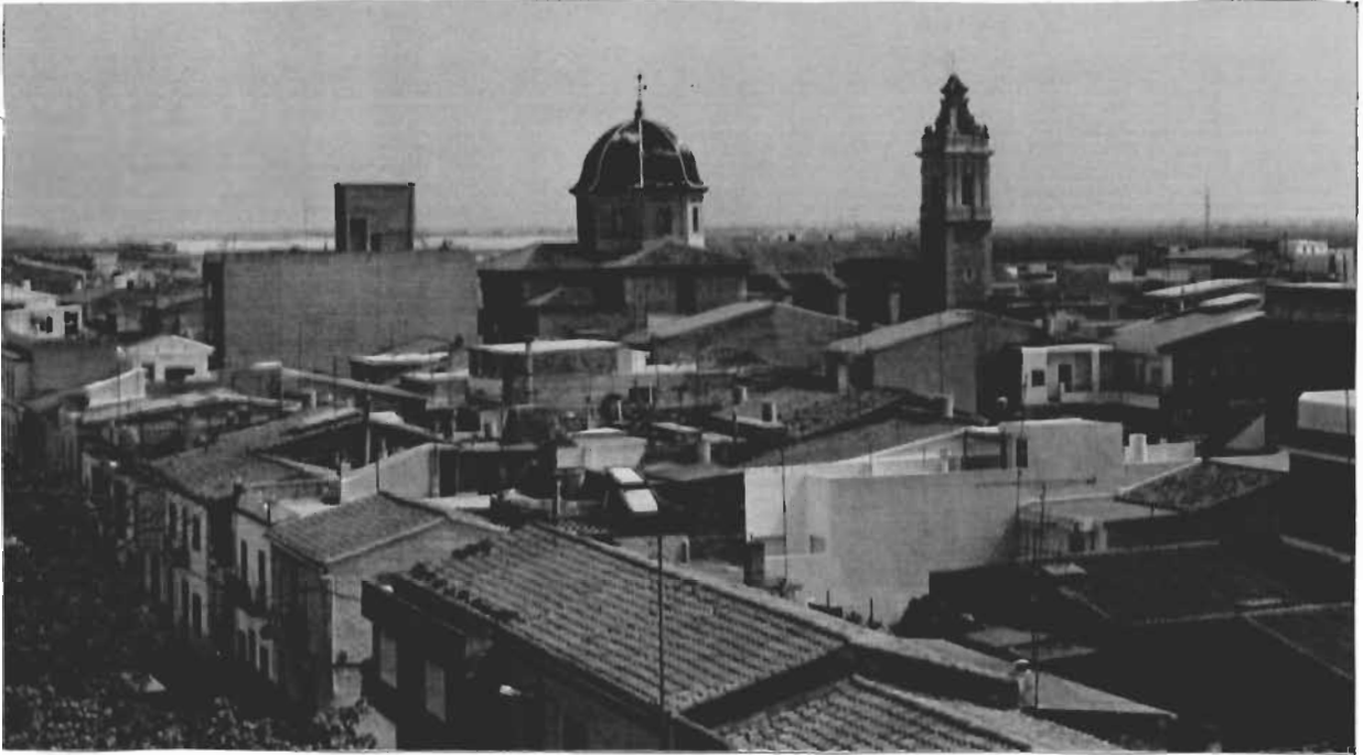
Vista general de l'església de l'Assumpció (Xilxes)

sultat és el que podem veure: un nucli històric nou (quina contradicció!) amb edificis moderns i, si ens descuidem, amb avingudes amples. Cal que reflexionem un poc i que apostem més per la restauració i no tant per la destrucció. Sols d'aquesta manera podrem conservar el poc patrimoni artístic, públic i privat, que encara ens queda, perquè el puguen heretar, en les millors condicions, els nostres successors, els xilxers i xilxeres del futur.