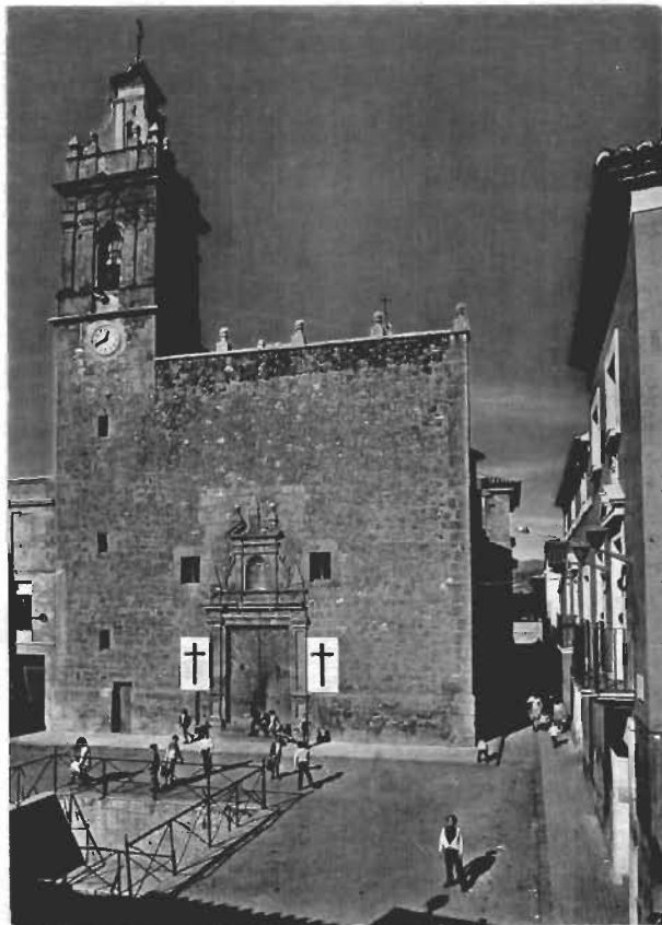
Façana de l'església de l'Assumpció (Xilxes) Principis dels anys 70.