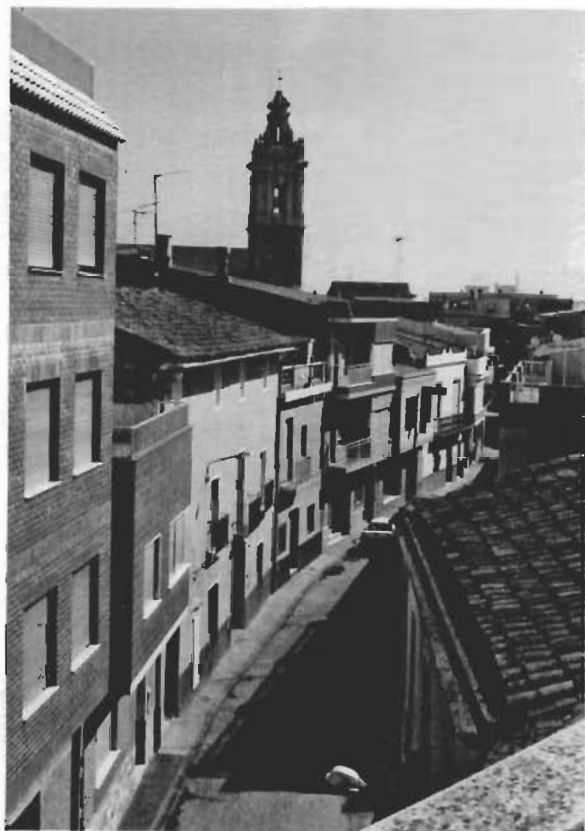
Vista del carrer Major amb la seua peculiar forma curvada i al fons el campanar de l'església (Xilxes).

realitzada al segle anterior. Així queda reflectit als manaments de la Visita Pastoral del bisbe Vilamitjana l'any 1862: